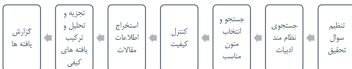
شکل ۱، مراحل هفت‌گانه فراترکیب، (لودویگسن و همکاران، ۲۰۱۶)، اقتباس از (ساندلوفسکی و باروسو، ۲۰۰۶)

در سال‌های اخیر، ترکیب کیفی پژوهش‌ها (QRS) ۱ به رویکردی ارزشمند برای مرور نظام‌مند در حوزه‌هایی نظیر پژوهش‌های اجتماعی تبدیل شده است (لودویگسن، هال، میر، فگرن، آگارد، اوهرنفلد ۲ ، ۲۰۱۶). به طور کلی، «یک فراترکیب کیفی ۳ »، نوعی روش کیفی است که داده‌های ورودی آن نتایج سایر مطالعات در موضوع مرتبط یا مشابه است (زیمر ۴ ، ۲۰۰۶). فراترکیب، روش تحقیق کیفی است که به ارائه ترکیبی تفسیرگونه از یافته‌های پژوهش‌ها می‌پردازد و هدف آن ایجاد چارچوب نظری و خلاصه‌سازی یافته‌ها بمنظور ایجاد دسترسی بیشتر و راحت‌تر به یافته‌های کیفی برای بهره‌برداری در پژوهش‌های تجربی است (ساندلوفسکی، باروسو و ویلس ۵ ، ۲۰۰۷). فراترکیب صرفاً به دنبال مرور ادبیات تحقیق و تجزیه و تحلیل کیفی داده‌ها به صورت یکپارچه و یا تحلیل ثانویه داده‌های اولیه بدست آمده از سایر مطالعات نیست؛ بلکه به دنبال تحلیل یافته‌های آن پژوهش‌هاست (زیمر، ۲۰۰۶). در این تحقیق برای شناسایی مفاهیم ۶ مورد استفاده در تحقیقات گوناگون حاکمیت شرکتی با رویکرد رفتاری، از روش فراترکیب استفاده می‌کنیم. لودویگسن و همکاران (۲۰۱۶) روش هفت مرحله‌ای «سندلوسکی و باروسو» را که در اغلب پژوهش‌های فراترکیب از آن استفاده شده است، شرح داده‌اند که در شکل ذیل خلاصه شده است: