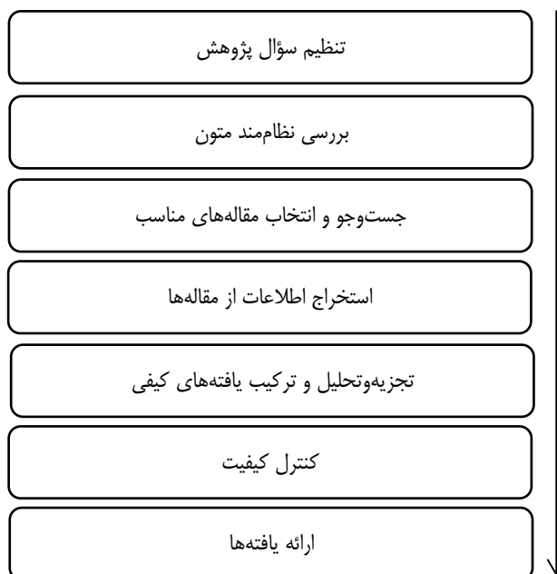
شکل ۱. مراحل فراترکیب

ارتقای دانش جدید کمک می‌کند و دید جامع‌تری را از حوزه بررسی شده به وجود می‌آورد. به دلیل پراکندگی و تنوع موجود در ادبیات الگوهای مدل کسب‌وکار مدور و نیز، برای ترکیب یافته‌های پژوهش‌های پیشین و دستیابی به دید جامع در این حوزه، روش فراترکیب روشی مناسب است. در این پژوهش برای اجرای روش فراترکیب، از روش هفت مرحله‌ای ساندلوسکی و باروسو استفاده شده است که مراحل آن در شکل ۱ مشاهده می‌شود (ساندلوسکی و باروسو، ۲۰۰۶).