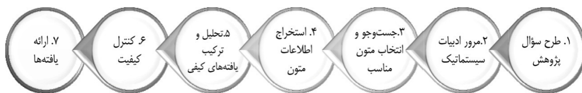
شکل ۱. گام‌های فراترکیب براساس روش هفت مرحله‌ای