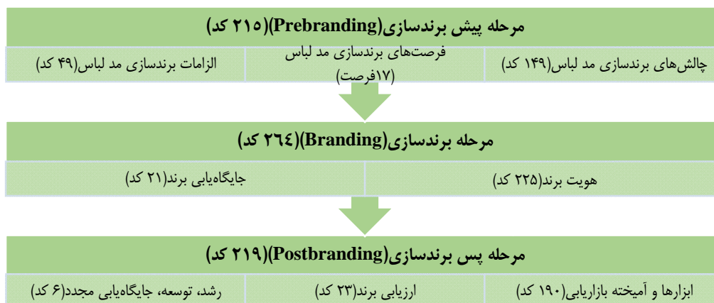
شکل ۱. مراحل کلی برندسازی و زیرمجموعه‌های هر مرحله در صنعت مد لباس

در نهایت پس از بررسی نظرات خبرگان و تحلیل آنها مدلی جهت برندسازی از نظرات و مصاحبه‌های آنها استخراج گردید و برای آنها ارسال گردید و از آنها خواسته شد تا نظرات خود را در مورد مدل نهایی بیان کنند. بعد از تغییرات جزئی دو مدل نهایی زیر استخراج گردید. در مدل اول محقق ۸ مرحله برندسازی گفته شده توسط کارشناسان و خبرگان را در سه مرحله کلی پیش‌برندسازی، برندسازی و پس‌برندسازی قرار داده که در زیر مشاهده می‌نمایید.