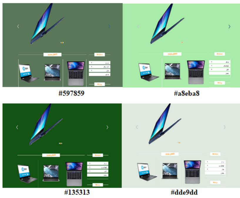
شکل ۲. تصاویر وبسایت‌های با کد سبز