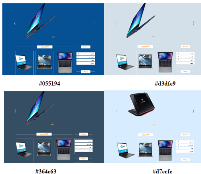
شکل ۳. تصاویر وبسایت‌های با کد آبی

گروه آزمایش از طریق اختصاص کد به آدرس لینک وبسایت و قرعه‌کشی دستی در چهار گروه مساوی در معرض رنگ آبی و رنگ سبز قرار گرفتند. گروه کنترل در معرض نوع رنگ خنثی (سفید)، اشباع رنگ خنثی و درخشندگی رنگ خنثی قرار گرفتند. گروه آزمایش و کنترل از طریق شبکه‌های اجتماعی که در گروه‌های عضویت محققان بودند، برای