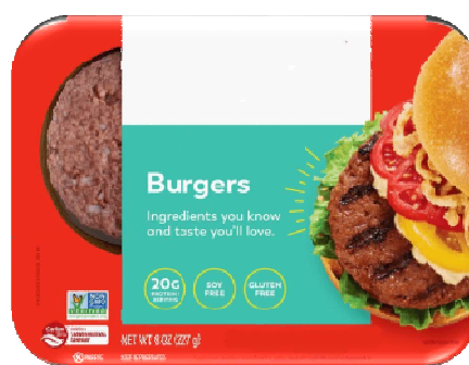
شکل ۲. محصول سبز با برچسب سبز