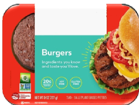
شکل ۳. محصول معمولی بدون برچسب سبز

محصول انتخاب‌شده در این پژوهش از طبقه فراورده‌های گوشتی (همبرگر) است. در پژوهش‌های مختلف در حوزه بازاریابی محصول سبز، محصولاتی دارویی، آرایشی، بهداشتی، منسوجات، محصولات غذایی، پوشاک، فعالیت‌های مالی، بانکداری، مسافرت و توریسم مورد مطالعه قرار گرفته‌اند. در پژوهش حاضر محصولی انتخاب شده است که ویژگی سبز بودن در آن ویژگی مهم تلقی شده و همچنین برای اکثر افراد با ویژگی‌های جمعیت‌شناختی، محصولی آشنا قلمداد شود. برای این منظور، ابتدا در یک مطالعه مقدماتی شامل ۳۰ نفر، از مصرف‌کنندگان خواسته شد تا بین محصولات در دو طبقه غذایی و خانگی، محصولی را انتخاب کنند که اهمیت سبز بودن در آن برایشان بیشتر است. درصد بیشتری از افراد (۵۲درصد)، محصول غذایی (همبرگر)، را انتخاب کردند. در طبقه فراورده گوشتی، همبرگر محصولی است که پاسخ‌دهندگان به‌خوبی از این دسته از محصولات آگاهی داشته، محصول در دسترس بوده و دارای ویژگی خنثی از نظر جنسیت است. علاوه بر این، به جهت آنکه تأثیر نام برند بر قصد خرید مصرف‌کنندگان تأثیرات مداخله‌گرانه‌ای نداشته باشد، این محصول (شکل‌های ۲ و ۳) بدون برند و تنها با برچسب سبز و ذکر قیمت در وبسایت نشان داده شد. همچنین به جهت آنکه سایر عوامل مؤثر بر آزمایش‌شوندگان در هنگام خرید شبیه‌سازی شده در سایت کاهش یابد و توجه بیشتری به انتخاب محصولات جلب شود، از رنگ خنثی و طراحی ستونی دوبه‌دو، برای مقایسه دوبه‌دوی محصولات یکسان با قیمت متفاوت استفاده شده است. محصول در دو وضعیت سبز با نشان برچسب سبز و غیرسبز بدون نشان برچسب سبز و هر یک با دو وضعیت قیمت بالا و قیمت پایین (در مجموع در چهار حالت) به‌صورت شکل‌های ۲ و ۳ در معرض نمایش گروه آزمایش قرار گرفت.