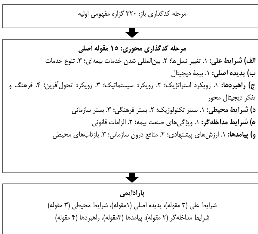
شکل ۱. فرایند مدیریت داده‌ها در مراحل کدگذاری

مطابق نظر اشتراوس و کوربین (۱۳۹۳) راهبردها اعمال، تعامل‌ها و کنش‌های افرادی هستند که در طرز عمل عادی و چگونگی مدیریت موقعیت‌ها در مواجهه با مسائل به کار برده می‌شوند. براساس مدل پارادایمی نظریه داده‌بنیاد، راهبردها، رفتارها و تعامل‌هایی هستند که تحت تأثیر شرایط مداخله‌گر و محیطی حاصل می‌شوند. با تحلیل مصاحبه‌های انجام‌گرفته در پژوهش، راهبردهای بیمه دیجیتال مطرح شد.