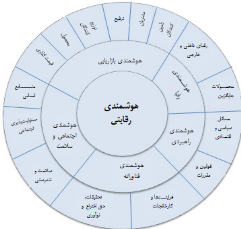
شکل ۴. مدل شماتیک هوشمندی رقابتی با بهره‌گیری از قابلیت‌های شبکه‌های اجتماعی در صنعت ماء‌الشعیر ایران