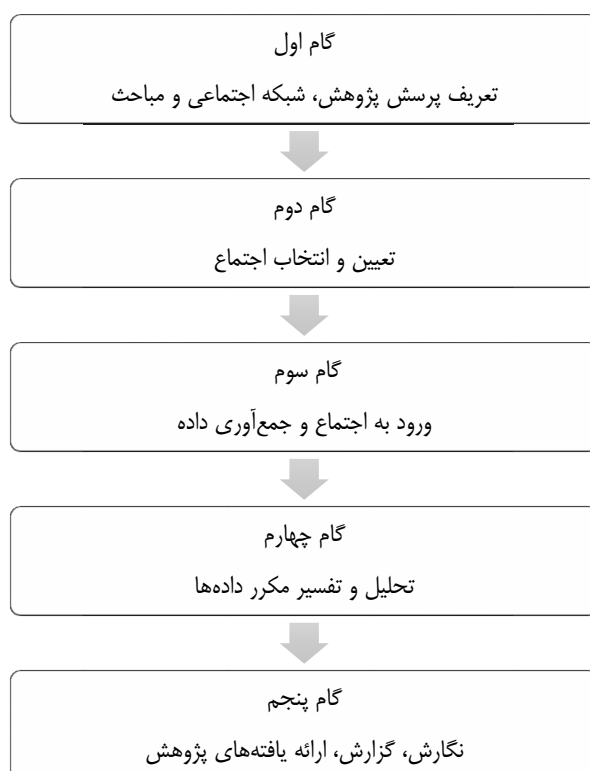
شکل ۲. خلاصه‌ای از گام‌های شبکه‌نگاری

این پژوهش از حیث هدف از نوع کاربردی است و رویکردی توصیفی را به کار گرفته و برای انجام آن روش شبکه‌نگاری (مردم‌نگاری آنلاین) انتخاب شده است. واژه نتنوگرافی (شبکه‌نگاری) از ترکیب دو واژه اینترنت و مردم‌نگاری نشئت گرفته است. نتنوگرافی روشی کیفی برای بررسی مبادلات آنلاین تعاملی بین کاربران اینترنت است (دی لاسس و فریر ۱ ، ۲۰۱۴). شبکه‌نگاری به طور ویژه برای پژوهش کاربران و جوامع حاضر در اینترنت ایجاد شده است (رولینگ، نیکل و وی ۲ ، ۲۰۱۴). در ادامه خلاصه‌ای از گام‌هایی که باید در شبکه‌نگاری طی شود به نمایش درآمده است.