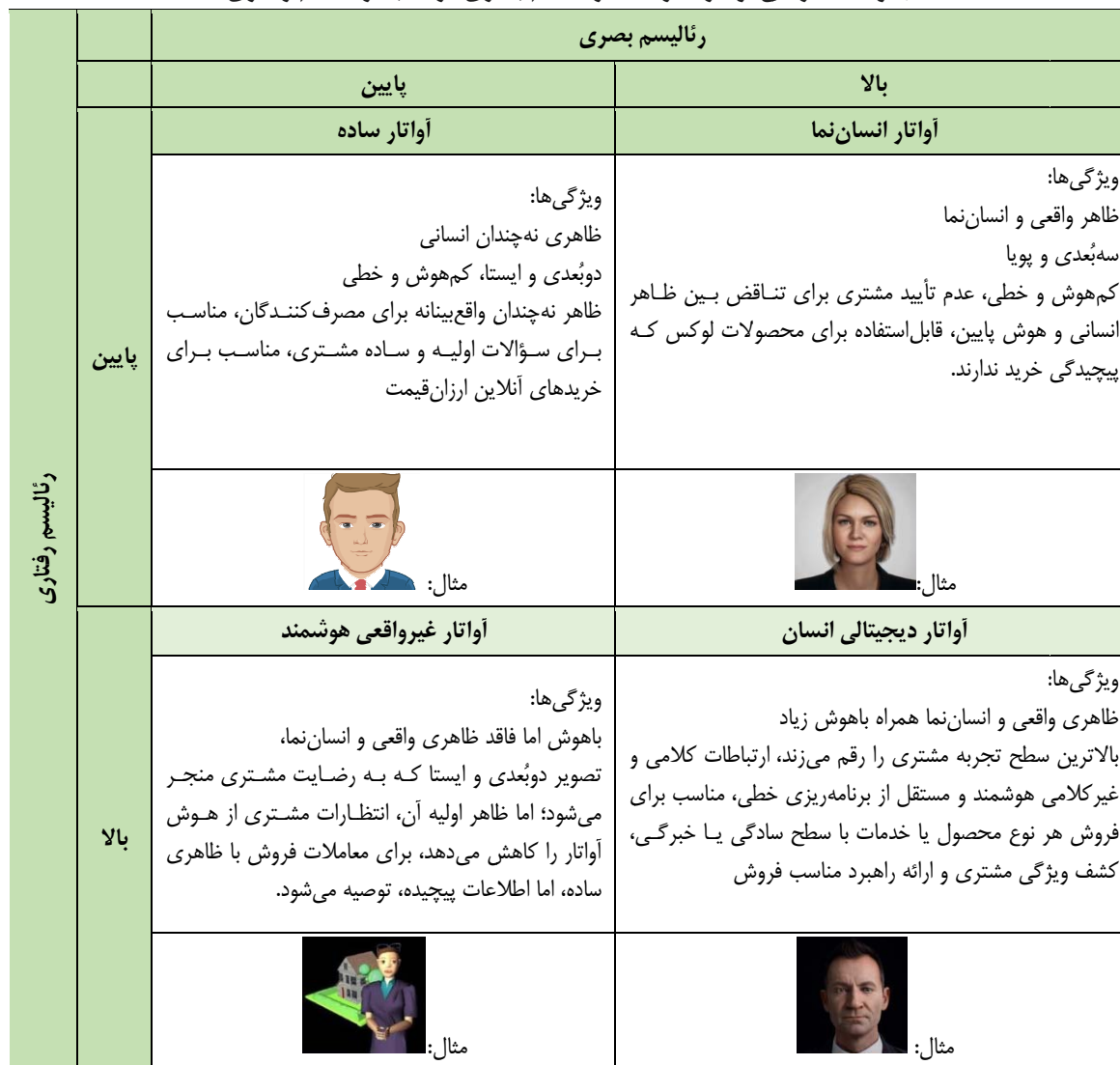
جدول ۱. طراحی آواتارها از حیث رئالیسم بصری در مقابل رئالیسم رفتاری