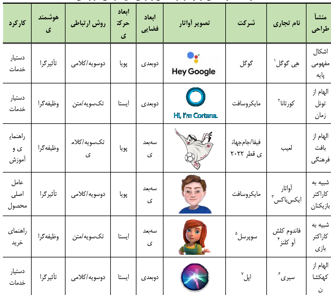
جدول ۲. نمونه‌هایی از آواتار بر اساس ویژگی‌های طراحی بازاریابی